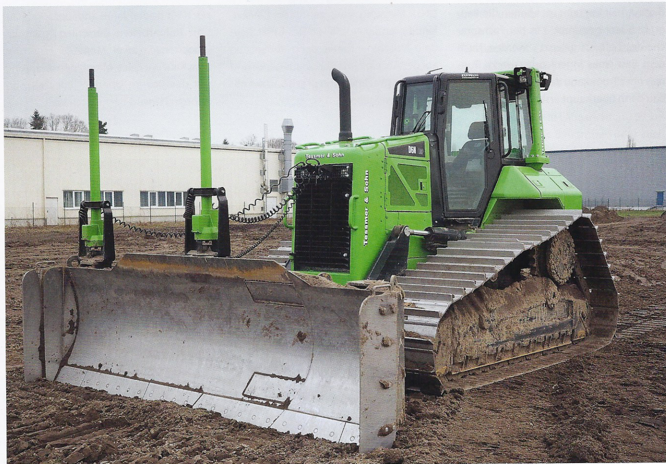
Auch wenn der Maschineneinsatz auf 400 Baustellen koordiniert werden muss, behält Tessmer & Sohn alles im Blick: Das PTC-Flottenportal GPS-Services erweist sich dabei als überaus nützliches Tool.

Wichtig ist im Straßenbau zudem ein exakter Arbeitsnachweis. Mit der mobilen Zeiterfassung kann man die Arbeitszeit der Mitarbeiter den jeweiligen Auftraggebern zuordnen und die Abrechnung vereinfachen. „Wir sind in der Lage, die Einsatzzeiten exakt zu kontrollieren. Im PTC-Flottenportal können wir die gefahrenen Routen, Stand- und Fahrzeiten auswerten. Diese Auswertung nutzen wir unseren Kunden gegenüber auch als Arbeitsnachweis“, berichtet Jens Sommer.